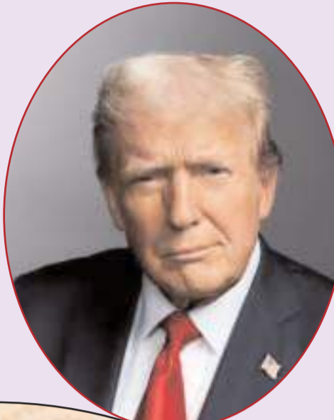
అనుచరులపై ఏకంగా అరెస్ట్ వారెంట్ విడుదల చేసింది.