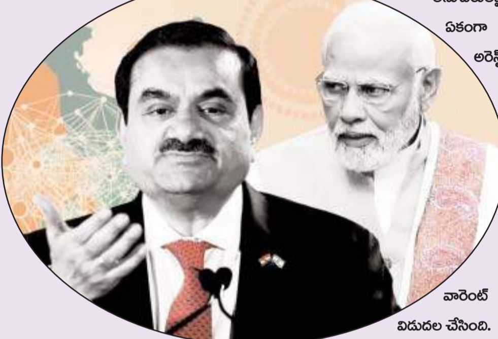
వారెంట్ విడుదల చేసింది.